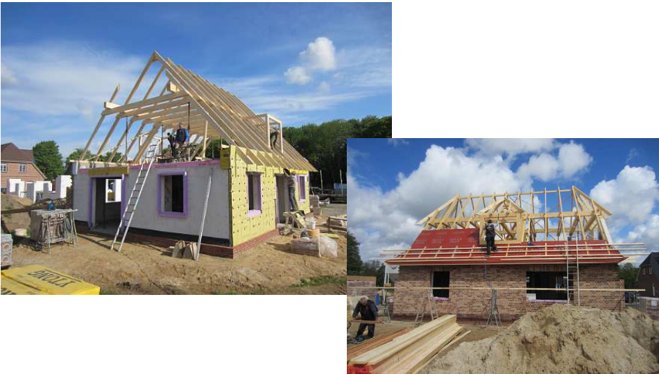
Eigene Maurer und Zimmerleute auf der Baustelle